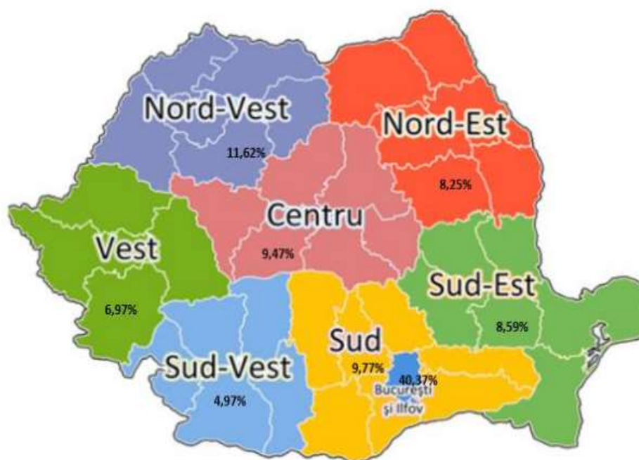
Figura nr. 3. Distribuția PBS pentru asigurarea generală în cele 8 regiuni de dezvoltare ale României